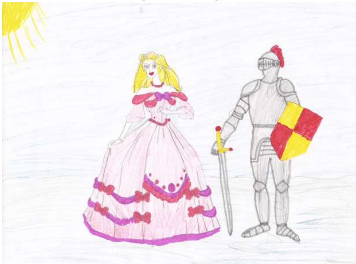
Иллюстрация к сказке группы 1

Жили-были дед да баба, и была у них кошка Мурка. На день рождения подарили деду и бабе красивый фонарь. Но когда его зажгли, в свет фонаря попала Мурка и исчезла. Долго искали они кошку, но так и не нашли. Однажды фонарь упал и разбился, кошка Мурка появилась. Дед и баба поняли, что фонарь волшебный. Они собрали осколки фонаря и выбросили в лес. Но когда на солнце осколки отражались и попадали на пробегающих животных, то они исчезали. А по ночам пугали людей. Все боялись ходить в лес. Дед и баба поняли из-за чего пропадают животные. Они пошли в лес, нашли осколки и закопали в землю. Сразу же появились все животные. Больше никто не боялся ходить в лес.